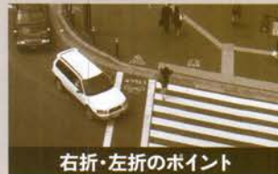
右折・左折のポイント

運転に慣れると、誰もが「しているつもり of 安全運転」になってしまう可能性がある。そのことを忘れずに、常に危険への注意力を持ち続ける事が大切だ。