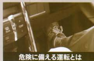
危険に備える運転とは