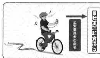
◆ 自転車運転者講習制度