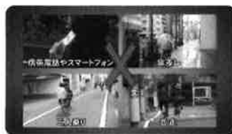
◆ 危険な運転の禁止