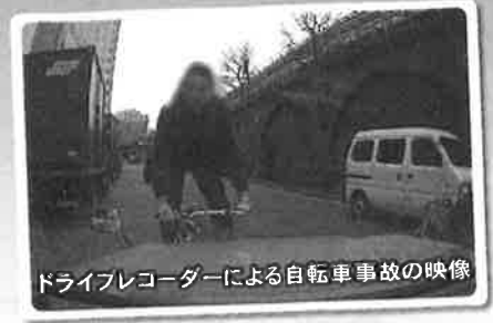
ドライブレコーダーによる自転車事故の映像

自転車は子どもから高齢者まで利用できる、とても便利な乗り物です。その反面、街なかでは「一時停止違反」「信号無視」「歩道での乱暴な運転」など、交通ルール違反が多く見られ、毎年自転車の交通事故が多数発生しています。自転車に安全に楽しく乗るために、正しい交通ルールと知っておくべき知識を説明していきます。