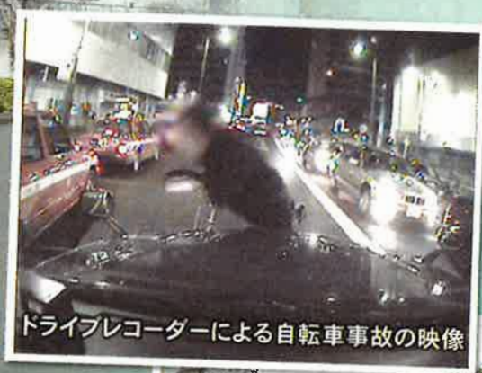
ドライブレコーダーによる自転車事故の映像