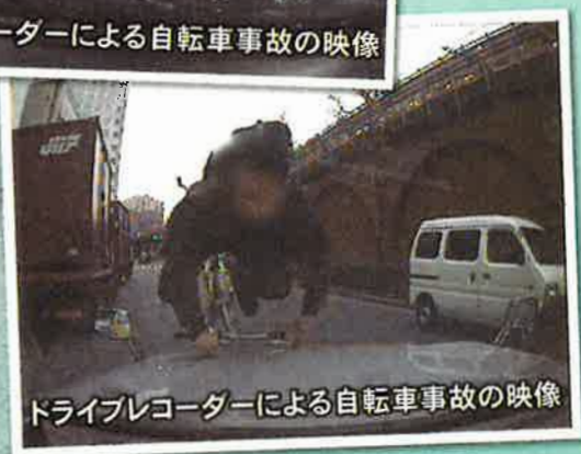
ドライブレコーダーによる自転車事故の映像